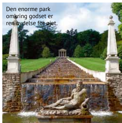
Den enorme park omkring godset er ren nydelse for øjet.