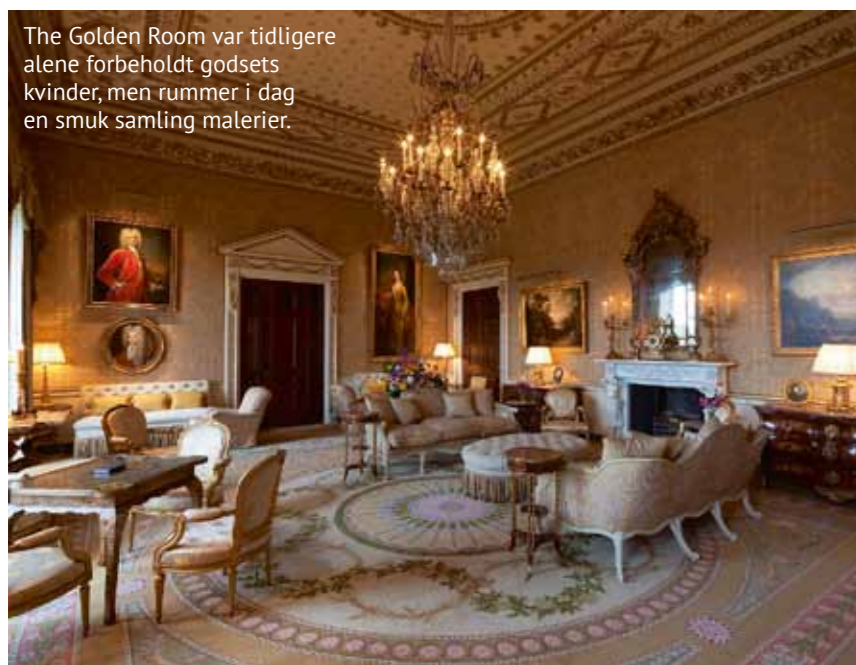
The Golden Room var tidligere alene forbeholdt godsets kvinder, men rummer i dag en smuk samling malerier.