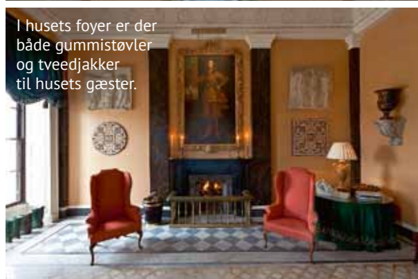
I husets foyer er der både gummistøvler og tveedjakker til husets gæster.