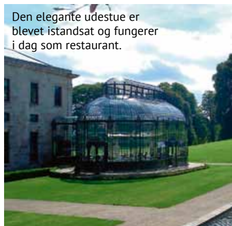
Den elegante udestue er blevet istandsat og fungerer i dag som restaurant.