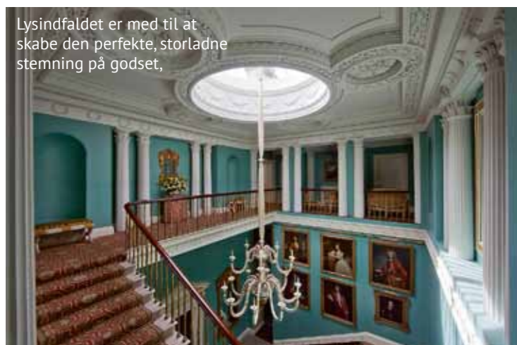
Lysindfaldet er med til at skabe den perfekte, storladne stemning på godset.