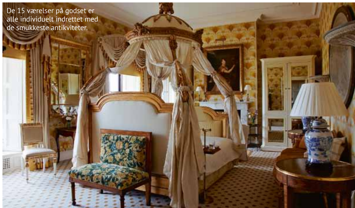
De 15 værelser på godset er alle individuelt indrettet med de smukkeste antikviteter.