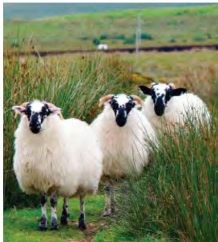
هذه الصفحة من الأعلى للأسفل مع عقارب الساعة: أحد قاعات الجلوس في بالي فين؛ مشهد من مدينة جالواي؛ الطبيعة الساحرة في أيرلندا وجالواي؛ أحد الأبواب الملونة في جالواي. الصفحة التالية: منحدرات موهير الرائعة.

إضافة إلى أرضية من الموازيك أمام المدخل الرئيسي. كانت هذه مفاجأة جميلة بالنسبة لجميع من عمل على المشروع، وقد تعاملنا مع هذه الأرضية كأبي قطعة من الأثاث الفاخر بعناية وحرص شديدين".